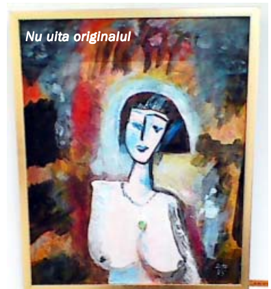
Nu uita originalul

lucrare cu o certă valoare estetică. „Observați cum se uită și de ce se uită așa tipa din tablou?” Răspunsul meu, inspirat, a tras eșarfa unei bucurii peste figura surprinsă a interlocutorului, toată scena fiind, în definitiv, izbândă ca o monedă de aur așezată în mâna plină de har a Maestrului Valeriu Scărlătescu!